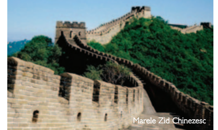
Marele Zid Chinezesc